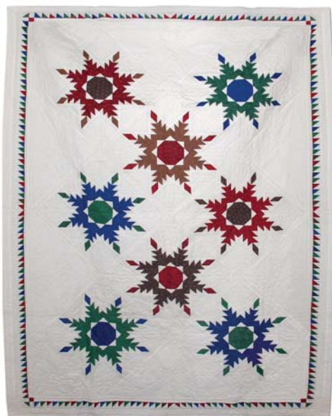
TOLLAS CSILLAGOK (2003)

Ez a székely festékes szőnyeg ihlette munkám tett ismerté a Céhben 120x160 cm