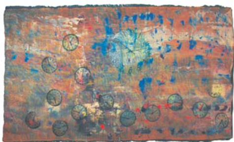
ANYÁM DEPRESSZIÓJA (2007)